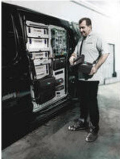
Wera 2go 1 - ¡Cree su maleta desde el exterior!