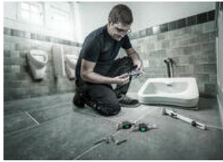
El clip práctico

Un posicionamiento seguro y una extracción más fácil