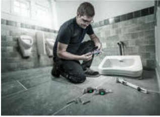
El clip práctico

Joker 6003: Para situaciones con ángulos de retorno de menos de 30°