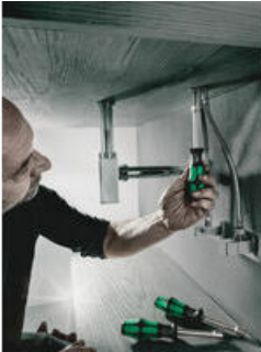
Varilla hueca para vástagos roscados sobresalientes