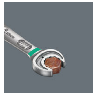
Geometría de doble hexágono

La inteligente geometría de doble hexágono de la Joker produce una unión perfecta y continua con el tornillo o la tuerca ¡esto sí que encaja bien! Y la placa metálica intercambiable y endurecida, de la que dispone la boca de la Joker, con ayuda de sus puntas extremadamente duras, se aferra fuertemente al tornillo. Ambas cosas evitan las molestias que provocan los deslizamientos incluso en pares de apriete muy elevados.