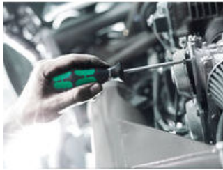
Destornilladores Kraftform Serie 300