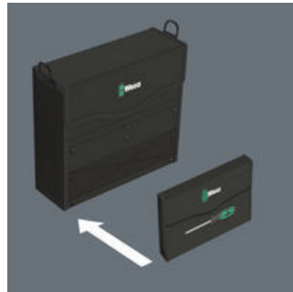
Adecuado para la conexión con el sistema Wera 2go.