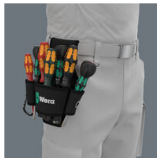
La bolsa para el cinturón está fabricada de un material robusto y puede ser fijado en el cinturón.