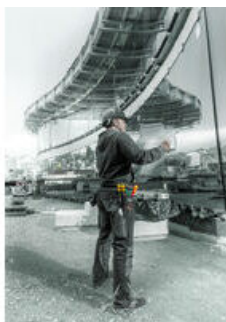
Juegos de destornilladores en una bolsa para el cinturón